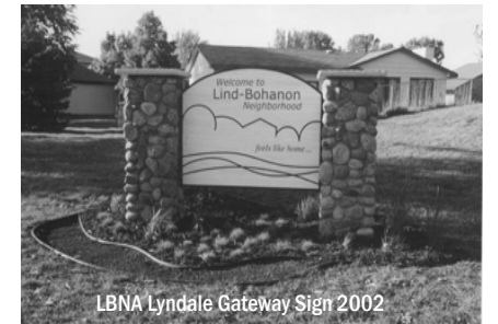
LBNA Lyndale Gateway Sign 2002

El nombre de la comunidad viene de combinar el nombre de la escuela, Jenny Lind (denominado para la Cantadora sueca con apodado "la Pájarita" que realizó para el circo de