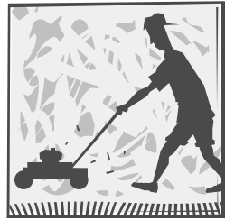
Caption describing picture or graphic.

les y efectivos o son obviamente inoperables no puede ser estacionado en su propiedad a menos que estan en un garaje. Los donativos del vehículos son aceptados por: Coches para el Valor: 612-520-0540 o Centro de Educación de Newgate 612-378-0177.