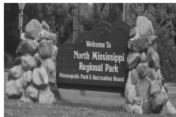
Park Entrance on 53rd Aviendo Norte

Norte del Misisipí, dirigen al norte y cruzan el 694 llegando al lado este del río, dirigen al sur y cruzan el Puente de Camden. O pueden viajar los paseos dirigiendo al sur en el Humboldt Greenway a la Paseo Conmemorativo de Victoria en las vecindades de Webber y Victory, o al noroeste por el Riachuelo de Shingle Creek a Brooklyn Center, el suburbio mas cerca. Hay varios parques del lado por Shingle Creek para pasear, merendar, o para jugar en para el día. O si se requiere un poco más espacio para la recreación,