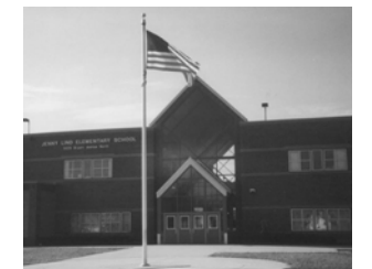
Jenny Lind Elementary

Cuida de niños en la vecindad—New Horizon @ Gethsemane , 4600 Avenida Colfax Norte, 612-521-0139